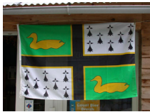
Drapeau du Pays de la Grande Brière

Source photographique et dessin: Raphaël Vinet ( http://www.kreabreizh.toile-libre.org )