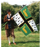
Drapeau du Pays de la Grande Brière tenu par un homme en costume traditionnel lors du festival Anne de Bretagne à Herbignac en juin 2002